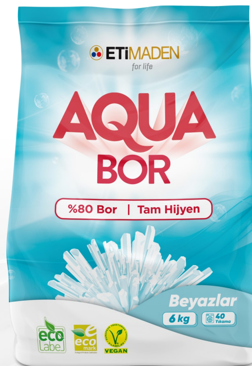
AquaBor для белого белья 6 кг