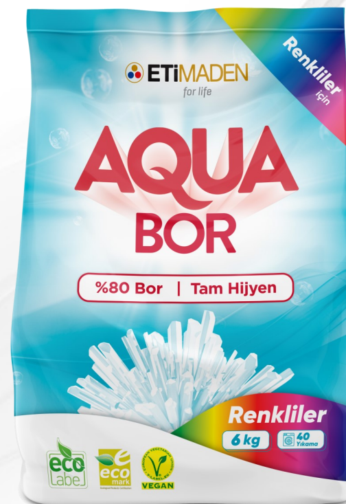
AquaBor для цветного белья 6 кг