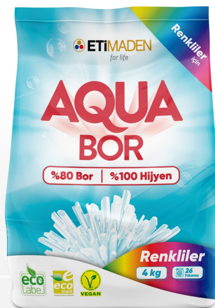
AquaBor для цветного белья 4 кг