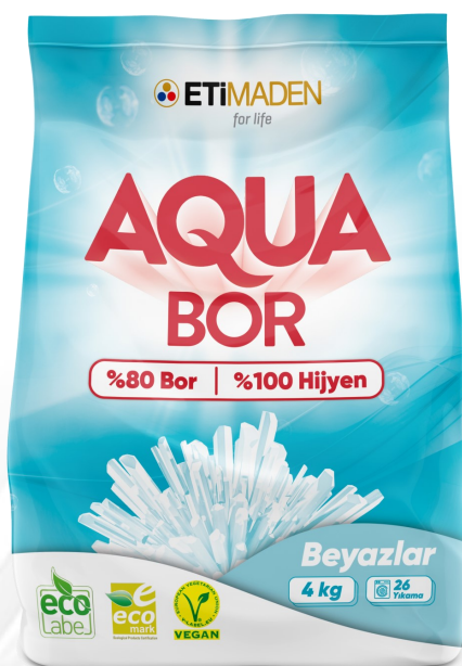
AquaBor для белого белья 4 кг